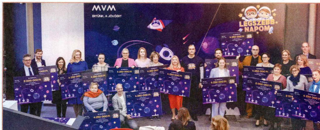
Az MVM Csoport idén novemberben százmillió forint támogatást adott át húsz, gyermekeknek segítő civil szervezet képviselőinek