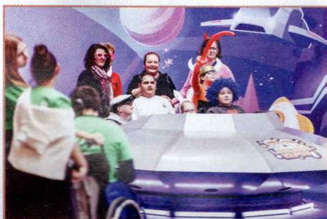
Az MVM Élménynapon a gyermekek igazi űrkalandot élhettek át

Az MVM Csoport idén novemberben százmillió forint támogatást adott át húsz, gyermekeknek segítő civil szervezet képviselőinek az immár 17. alkalommal megrendezett MVM Élménynap - Legszebb napom elnevezésű rendezvényén. Az egész napos eseményen a társaságcsoporthoz az űrtematika jegyében nyújtott feledhetetlen élményt, és szervezett felszabadult, örömteli pillanatokban gazdag programokat mintegy 800 hátrányos helyzetű és beteg gyermek számára.