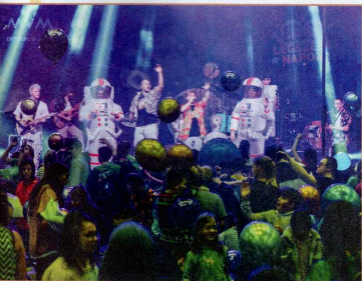
A The Biebers koncertje fergeteges hangulatot teremtett az MVM Élménynapon

Az MVM Csoport számára - ahol több évtizedes hagyománya van a társadalmi és közösségi szerepvállalásnak - a karitatív célok melletti elkötelezettség kiemelten fontos. Az évente megrendezett Élménynappal a társaságcsoporthoz nemcsak büszkén áll ki egy nemes cél mellett, de munkatársait is arra ösztönzi, hogy vegyenek részt hasonló, felemelő eseményeken és tapasztalják meg maguk is az összetartás erejét.